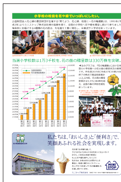
〈レイアウト見本〉表4

●色校正（簡易校正）＝1回（財団本部／東京事務所各2部送付） ●製品納品場所＝財団本部（一括）