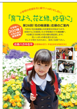
〈レイアウト見本〉表1