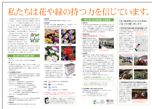
〈レイアウト見本〉中面（見開き）